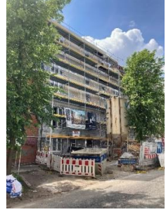
Kita Projensdorfer Straße