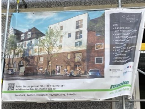
Kita Rendsburger Landstraße